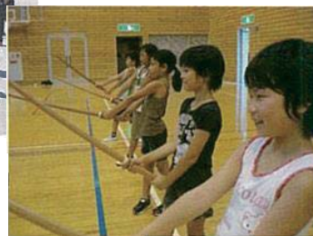
チャンバラフィットネス