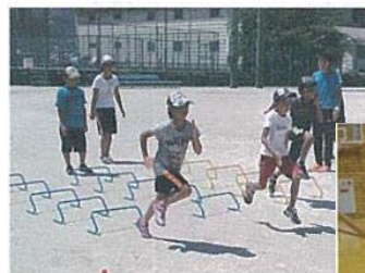
ジュニア陸上教室

スポーツケア講習会、バレーボール大会、 ソフトボール大会、軟式野球大会、 魚つかみ大会