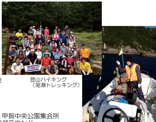
登山ハイキング (尾瀬トレッキング)