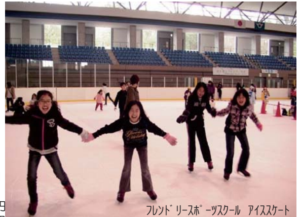
フレンドリースポーツスクール アイススケート