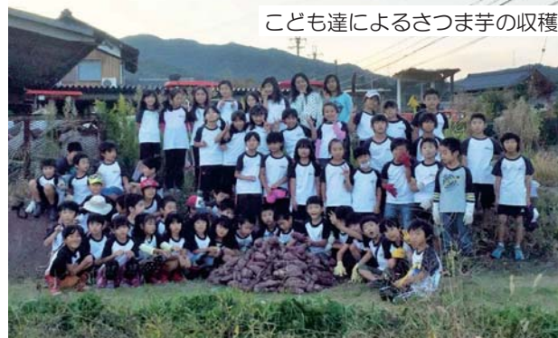
子ども達によるさつまいもの収穫