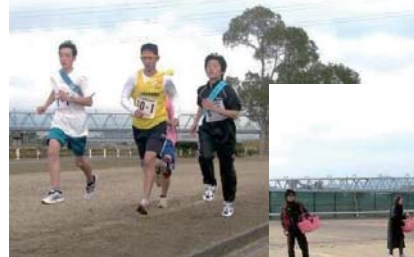
びわ湖若鮎駅伝大会