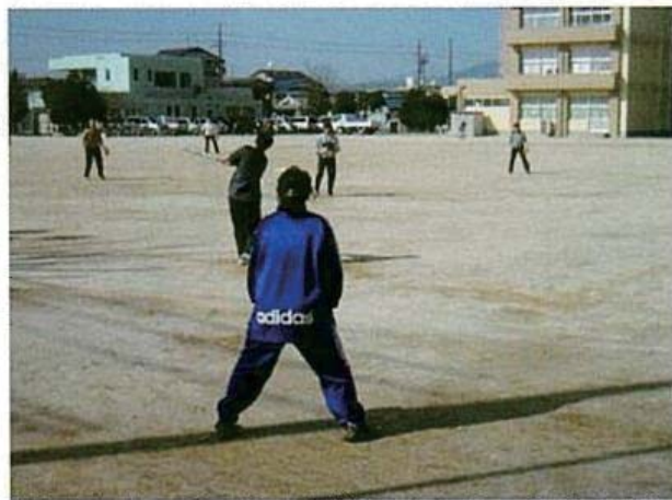
もりもりスポーツ広場

卓球、ビーチボール、キンボール、ドッチビー、ピロポロ、バドミントン、グラウンド・ゴルフ、ウォーキング、地域交流スポーツ大会、もりもりスポーツ広場