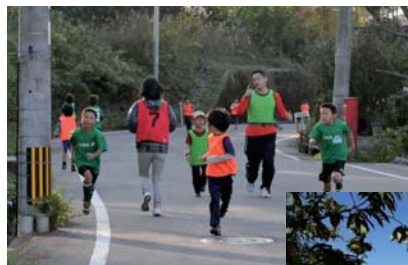
ゆっくりマラソン大会