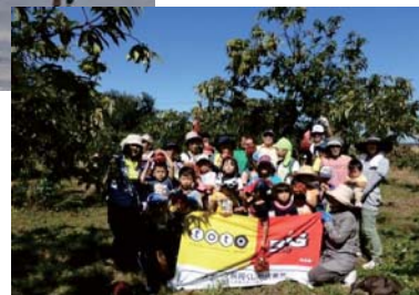
ウォーキング&栗ひろい