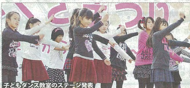
子どもダンス教室のステージ発表