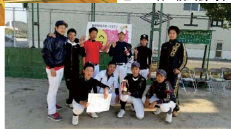
ピース杯 軟式野球大会