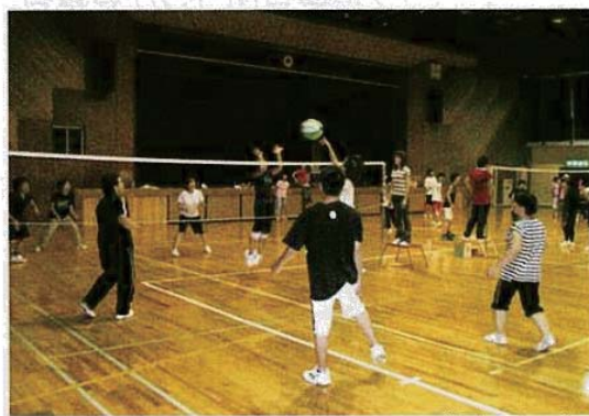
ビーチボールバレー

クラブ設立 平成19年2月24日 対象区人口 約6,000人 教育環境 保育園2園、小学校4校、中学校1校 指導者数 10名 入会金 なし 年会費 中学生3,000円、15歳以上5,500円、 65歳以上4,000円(各保険料1,000円) ファミリー10,000円(1人保険料1,000円) ビーチボールリーグ限定会員1,000円(保険料1,000円) 活動日数 週5日 活動場所 マキノ土に学ぶ里研修センター、マキノピックランド 既存団体との関わり 将来的に、体育協会競技部およびスポーツ少年団と連携を図りたい。