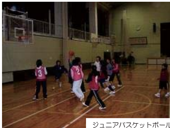
ジュニアバスケットボール