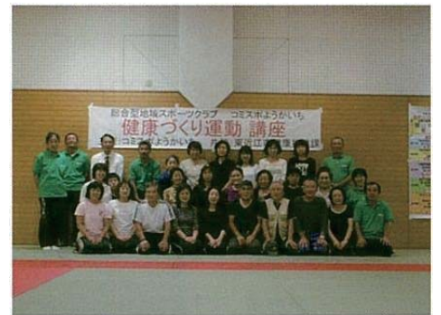
健康づくり運動講座

既存団体との関わり 各種団体(体協、スポ少、学校開放利用団体等)とは、 お互いに理解、協力し合いながら共立共存を図っている。