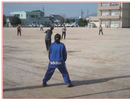
もりもりスポーツ広場

既存団体との関わり イベント開催時に指導等を依頼する場合あり (体育協会・スポ少など)