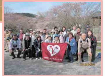
三井寺・琵琶湖疎水ウォーキング