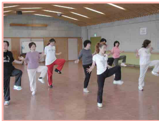
リズムウォーキング