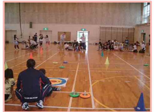
体験教室(カローリング)

既存団体との関わり スポ少とは連携をとり、スポーツへの導入面と技術面をサポートする関係である。(体育協会・スポ少など)