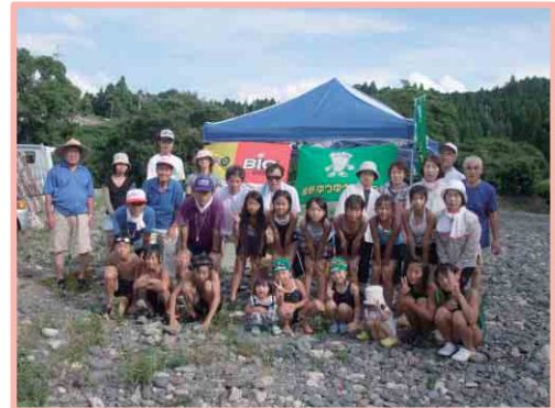
スマイルスポーツ広場(川遊び)