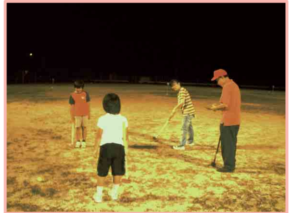
グラウンド・ゴルフ大会