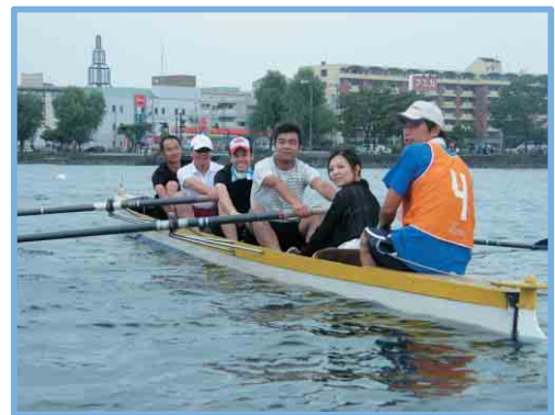
びわこ市民レガッタ2010