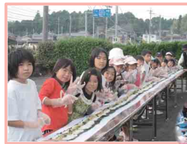
収穫祭(長巻さずし作り挑戦)

既存団体との関わり スポーツ少年団を含んだクラブ・甲賀陸協、伴谷地域福祉協議会と連携 (体育協会・スポ少など)