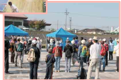
さわやかウォーキング