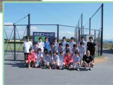
サッカーチーム(聖泉JFC)