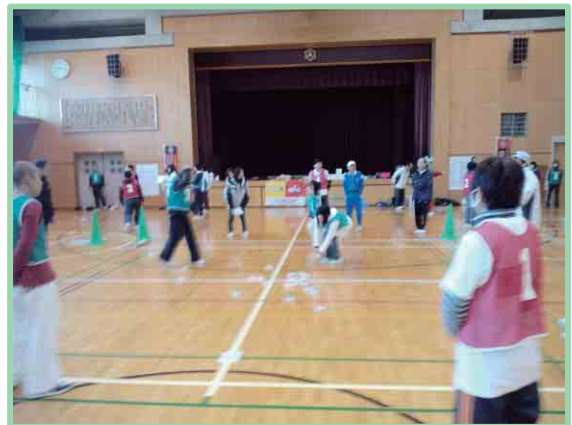
スーパーカロム大会(プレ事業)