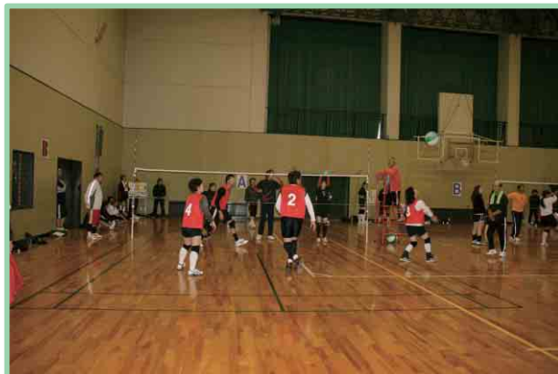
ビーチバレー教室