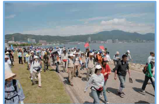
大津市内縦断60kウォーク