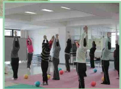
シェイプアップスクール