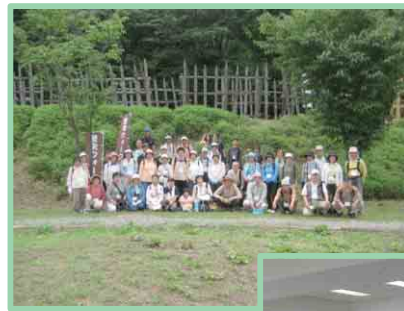
ときめき歴史ウォーク

既存団体との関わり 体協の活動はこれまで通り、クラブ賛同者が会員として参画。 (体育協会・スポ少など)