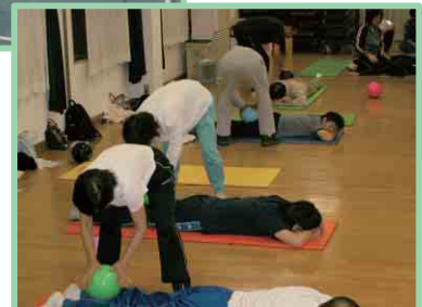
健康づくり出前講座