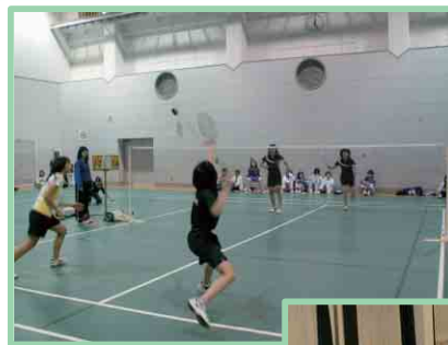
コミスポカップ バドミントン大会

既存団体との関わり 各種団体(体協、スポ少、学校開放利用団体等)とは、お互いに理解、協力し合いながら(体育協会・スポ少など) 共立共存を図っている。