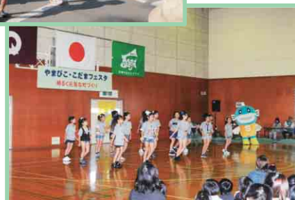
やまびこ・こだまフェスタ