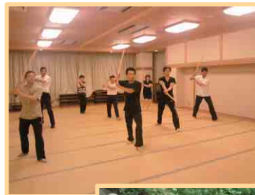
チャンバラフィットネス