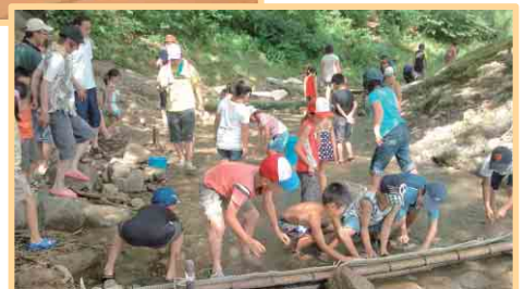
ジュニアスポーツ教室