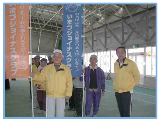
クラブ交流大会2010 in 米原

既存団体との関わり (体育協会・スポ少など) 将来的に体育協会競技部およびスポーツ少年団との連携を図りたい。