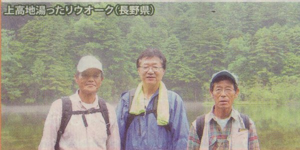
上高地湯ったりウォーク(長野県)